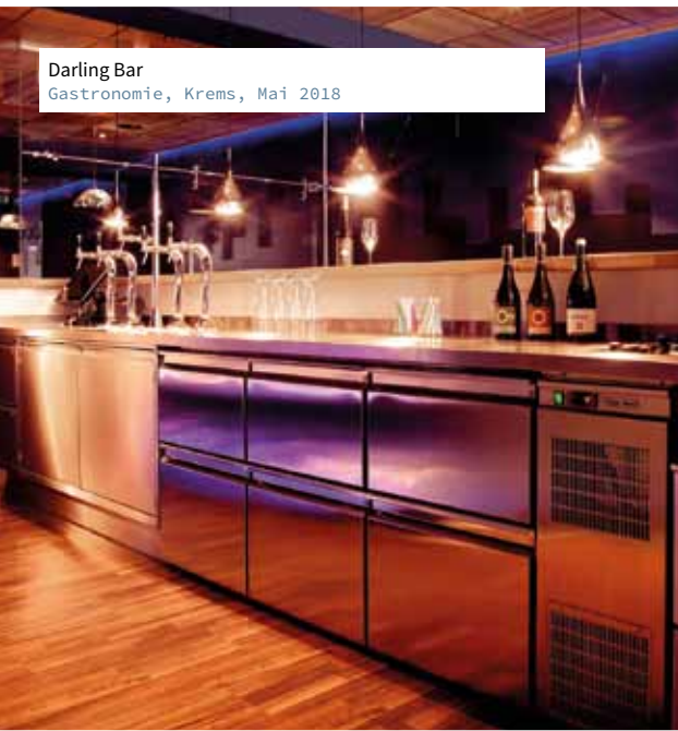
Darling Bar Gastronomie, Krems, Mai 2018