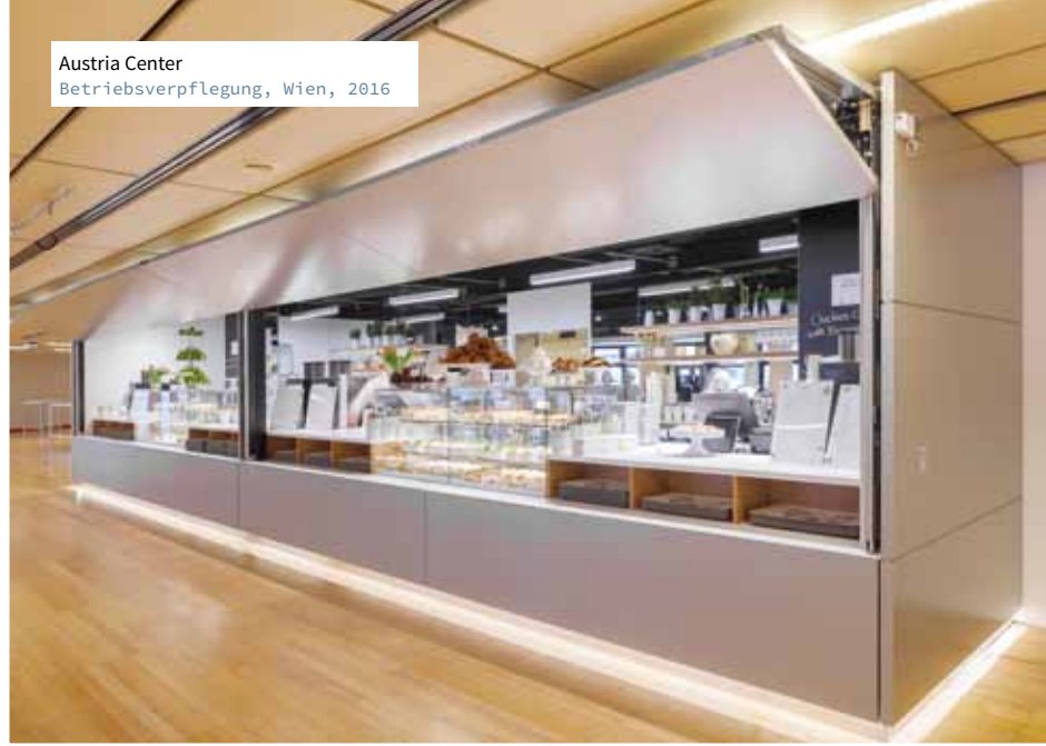
Austria Center Betriebsverpflegung, Wien, 2016