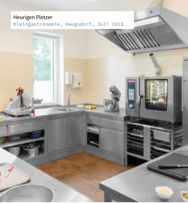
Heurigen Pletzer Kleingastronomie, Haugsdorf, Juli 2018